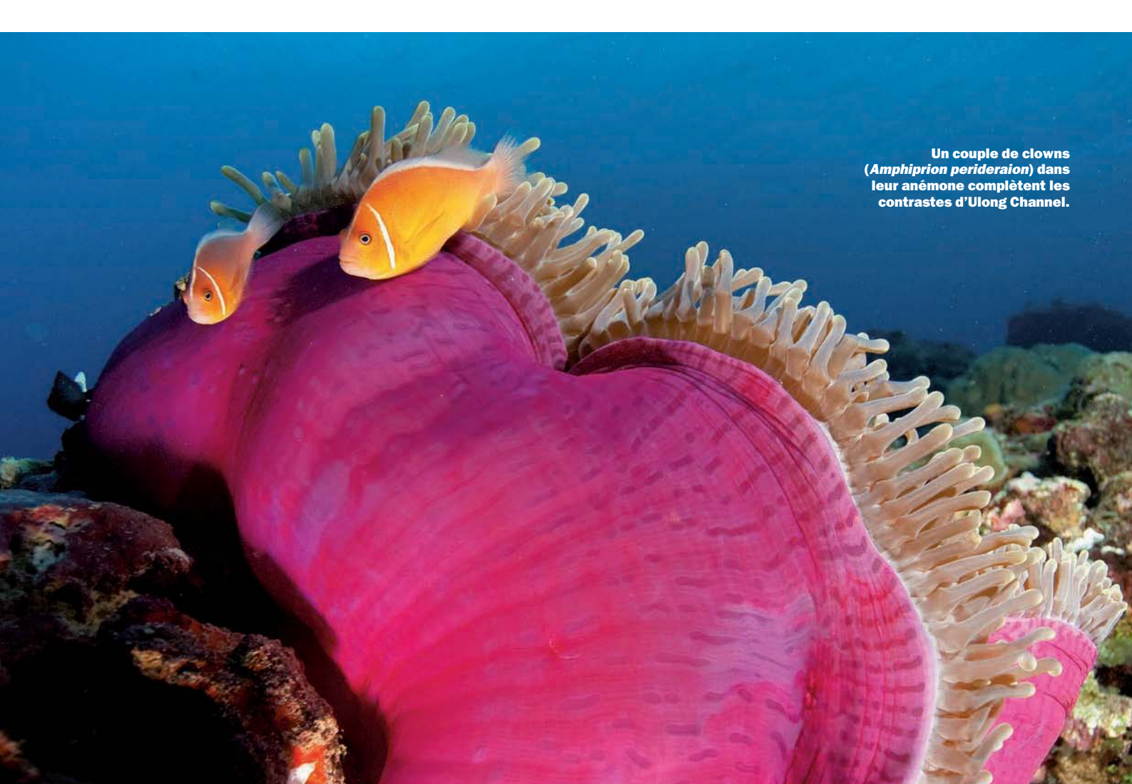
Un couple de clowns ( Amphiprion perideraion ) dans leur anémone complètent les contrastes d'Ulong Channel.