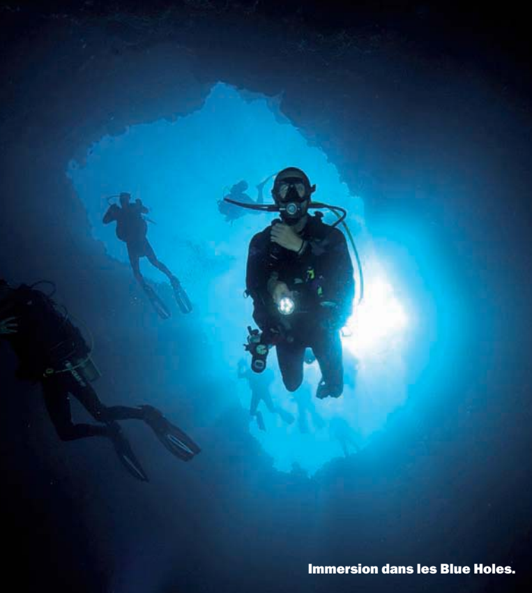
Immersion dans les Blue Holes.

Issues des grands phénomènes hydrogéologiques qui ont donné naissance aux archipels du Pacifique, les îles de Palau sont la mémoire de la vie qu'elles ont connue en tant que récif corallien lorsque les océans recouvraient la surface du globe. Comme dans chacun de ces environnements privilégiés, le récif a gardé tout son éclat sous la surface et se présente comme l'un des plus riches de cet océan, méritant largement son classement au rang des merveilles sous-marines du monde. De la faune macro aux grands pélagiques, la zone regroupe pas moins de 2000 espèces de poissons, plus de 700 types de coraux et anémones, mais aussi des dizaines d'épaves posées sur des petits fonds et que la vie sous-marine a depuis colonisées pour les transformer en récifs artificiels de classe. La luxuriance ne s'arrête pas là puisque, hors faune et flore, la topographie des lieux elle-même offre une variété d'ambiances étonnantes, des tombants et canyons de Peleliu, en passant par le canal de Ulong et les trous bleus de Ngemelis, jusqu'aux lacs intérieurs qui cachent eux aussi bien des surprises saisissantes. Un paquet de biodiversité, donc, devant