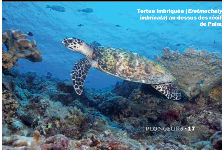
Tortue imbriquée ( Eretmochelys imbricata ) au-dessus des récifs de Palau.