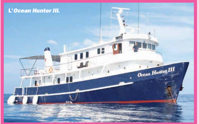
L'Ocean Hunter III.

Un brevet Advanced/Niveau II et 50 plongées minimum sont requis; l'expérience des dérivantes est un plus sur certains sites où les courants