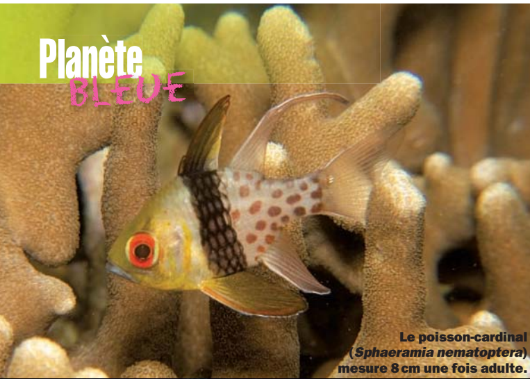
Le poisson-cardinal ( Sphaeramia nematoptera ) mesure 8 cm une fois adulte.